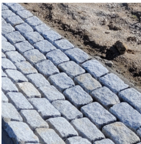
Figur 2 - Brostensrende som skal beskyttes

Eksempler på brosten og render som skal beskyttes, fremgår af figur 2 og 3.