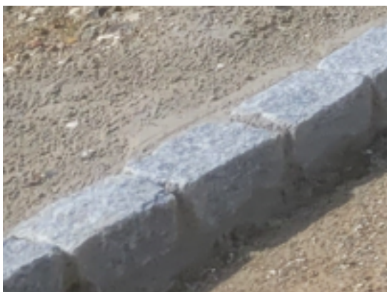
Figur 3 - Kantbegrænsning af brosten som skal beskyttes